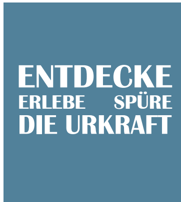
Woche-HBZ Wandertag am 28. April